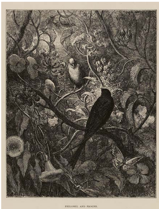
The Fables of La Fontaine, Jean, de La Fontaine, s.d., Londres, 1885

En 2016, Azentis a de nouveau été choisi par la Bibliothèque nationale Universitaire pour réaliser la numérisation d'un ensemble de 97 livres illustrés par Gustave Doré et conservés à la bibliothèque des Musées de Strasbourg, à la Médiathèque André Malraux et à la BNU.