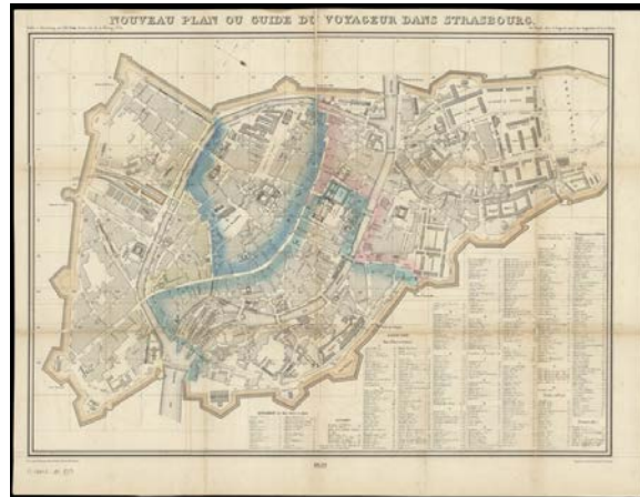
Nouveau plan ou guide du voyageur dans Strasbourg / gravé par F. Delamare

Azentis a travaillé à plusieurs reprises pour la Bibliothèque nationale universitaire (BNU) de Strasbourg. Leur collaboration a débuté en 2012 dans le cadre d'une commande de numérisation de 104 cartes. La prestation a été réalisée dans les ateliers d'Azentis et les images sont consultables sur Gallica et Numistral .