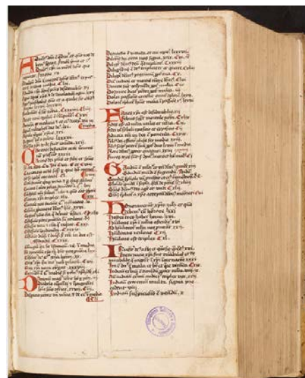
Preclarissima divi Aurelii Augustini sermonum opera, summa nuper diligentia revisa atque recognita... Augustin, 1521